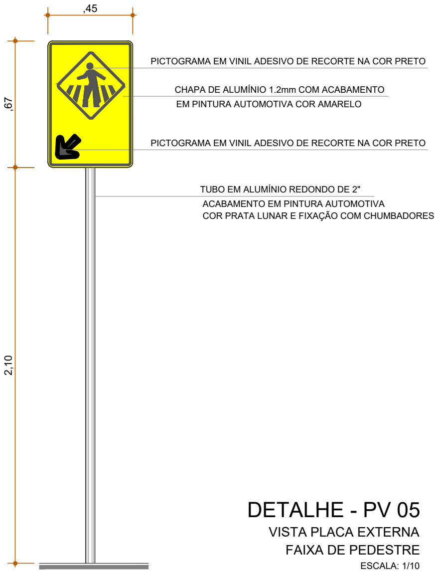
DETALHE - PV 05 VISTA PLACA EXTERNA FAIXA DE PEDESTRE ESCALA: 1/10